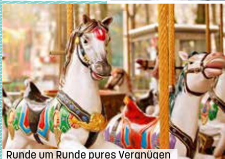
Runde um Runde pures Vergnügen