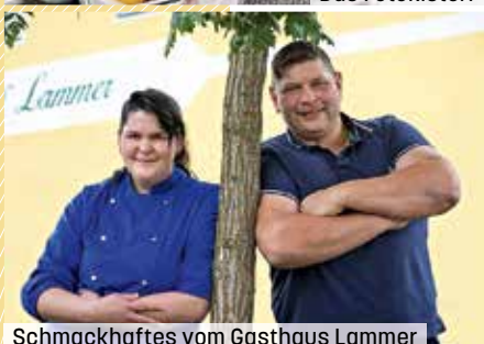
Schmackhaftes vom Gasthaus Lammer