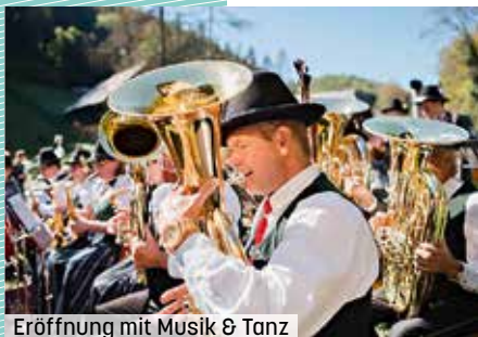
Eröffnung mit Musik & Tanz