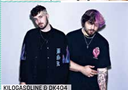
KILOGASOLINE & DK404