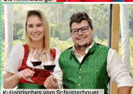
Kulinarisches vom Schusterbauer