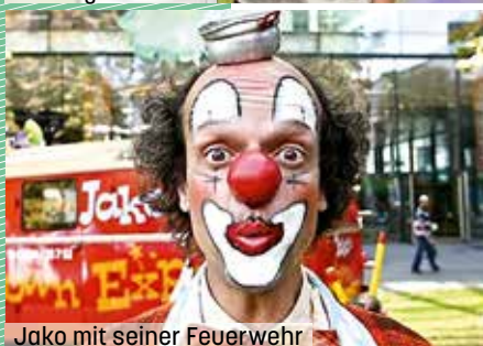
Jako mit seiner Feuerwehr