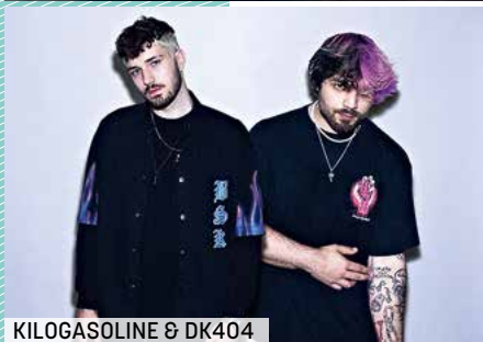
KILOGASOLINE & DK404