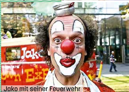
Jako mit seiner Feuerwehr