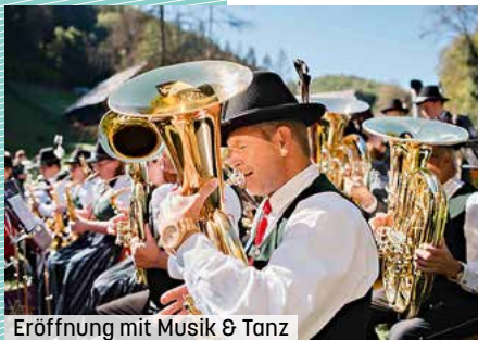
Eröffnung mit Musik & Tanz