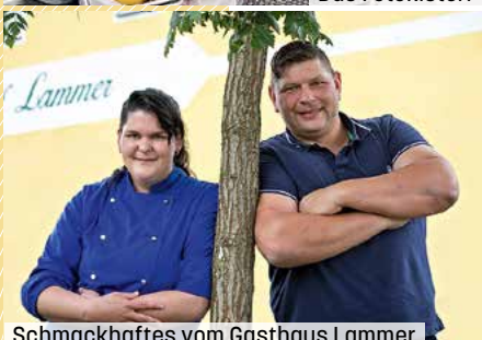
Schmackhaftes vom Gasthaus Lammer