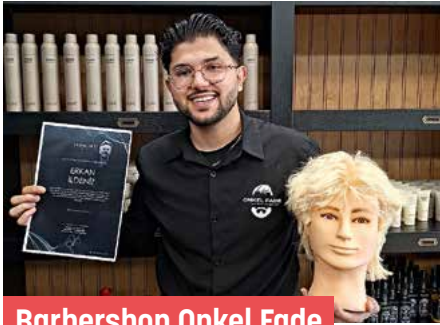
Barbershop Onkel Fade