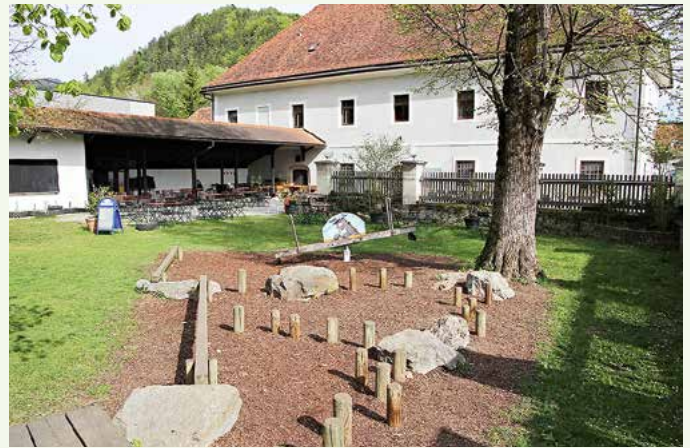
Der Kinderrechteweg ist ein beliebtes Ausflugsziel für die ganze Familie. Am Weg befinden sich drei Gaststätten mit Spielplätzen.