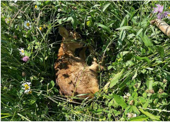
Rehkitze, versteckt im hohen Gras, sind bei Mäharbeiten nahezu unsichtbar. Um sie zu finden, werden sie mit Drohnen aufgespürt.