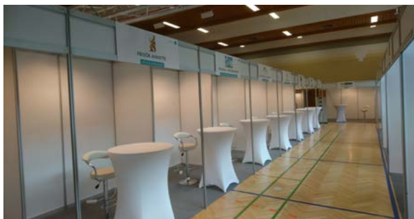
Kojen „Small“ ( 2 x 2 m) mit Grundausrüstung