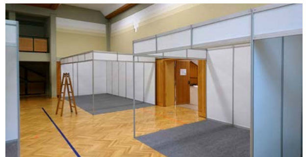
Vorne: Koje „Medium“ (3 x 3 m) als Eckstand Hinten: Koje „Large“ (3 x 5 m) als Eckstand