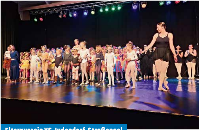
Elternverein VS Judendorf-Straßengel