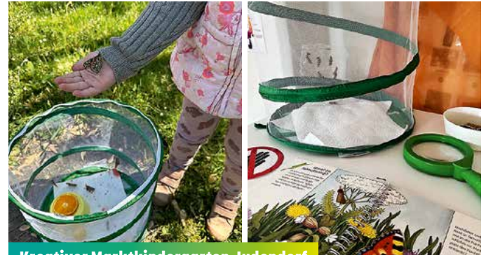
Kreativer Marktkindergarten Judendorf

Die Kinder bestaunten landwirtschaftliche Geräte von einst und heute und streichelbare Milchkühe im Freilaufstall. Mathematische Vorläuferfertigkeiten wie Größenvergleiche und Zählen konnten mit Hilfe von frisch gelegten Eiern, Hühnern, Ziegen, Eseln, Pferden, ausgewachsenen Kühen und Kälbern und Dimensionen der Traktorreifen erfahren werden. Hofhund Finnly, die neugeborenen Zwillingssäbber Fina und Stella sowie der Ziegenbock Josef ließen die Herzen der Kinder höherschlagen. Selbstgebackene Weckerln, Joghurt und Natursäfte bildeten den kulinarischen Abschluss dieser besonderen Hofführung.