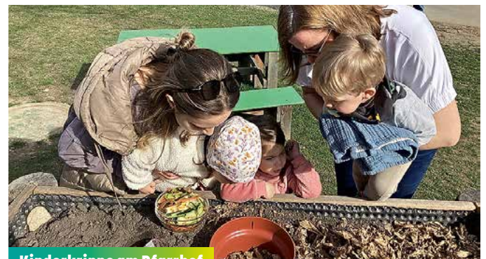
Kinderkrippe am Pfarrhof

Die Arbeit mit den Bee-Bots zeigte eindrucksvoll, wie spielerisch Kinder an digitale Bildung, technisches Verständnis und mathematisches Denken herangeführt werden können – mit viel Freude, Kreativität und Entdeckergeist.