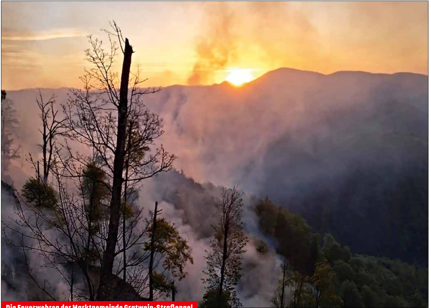
Die Feuerwehren der Marktgemeinde Gratwein-Straßengel