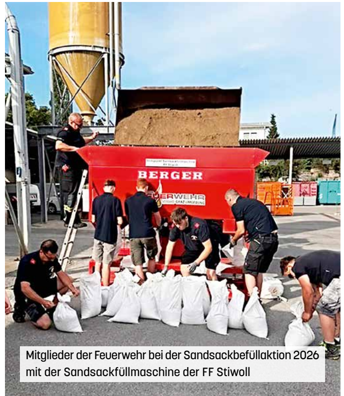
Mitglieder der Feuerwehr bei der Sandsackbefüllung 2026 mit der Sandsackfüllmaschine der FF Stiwill

Wir möchten in diesem Zusammenhang nochmals auf die geltenden Einschränkungen in der Fahrradzone hinweisen: In diesem Bereich gilt die Fahrradstraße – Kraftfahrzeuge sind nur für Anrainerinnen und Anrainer sowie im Zu- und Abfahrtsverkehr erlaubt. Die zulässige Höchstgeschwindigkeit beträgt 30 km/h, Radfahrende haben Vorrang. Wir danken allen für die Rücksichtnahme und das rücksichtsvolle Miteinander im Straßenverkehr.