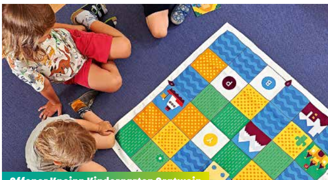
Offener Kneipp Kindergarten Gratwein

Durch genaues Beobachten, Experimentieren und gemeinsames Entdecken fördern wir Neugier, Sprache, mathematisches Denken sowie einen achtsamen Umgang mit der Natur. Das Projekt verbindet Lernen, Staunen und Forschen auf kindgerechte Weise.