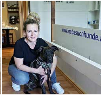
Verein der Krebssuchhunde