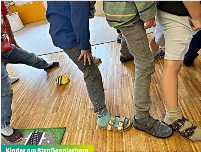
Kinder am Straßenglerberg