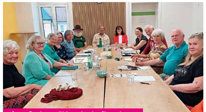
Biografische Erzähl- und Schreibwerkstatt