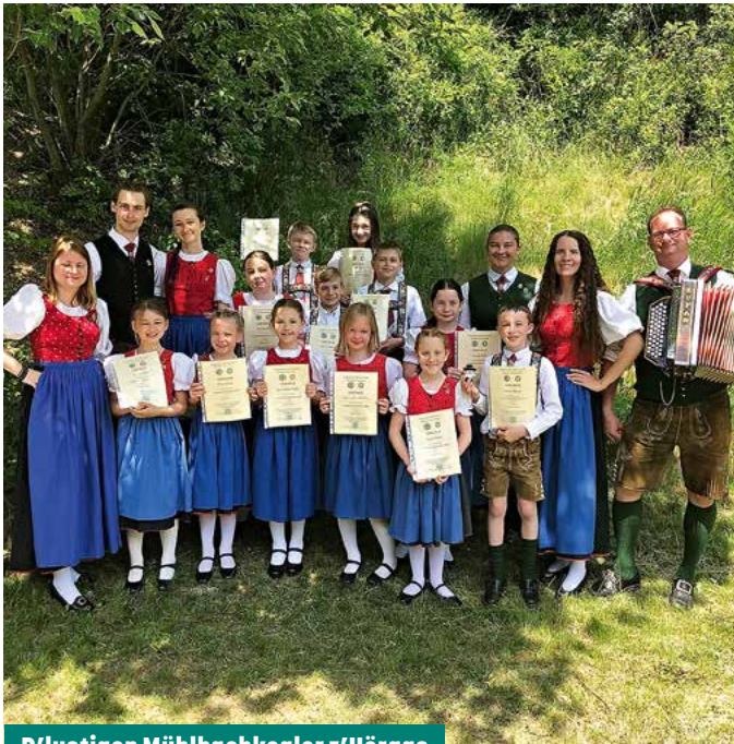
D'lustigen Mühlbachkogler z' Hörgas